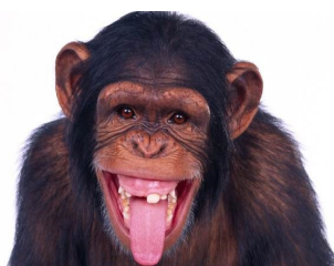
pesten ..... ???