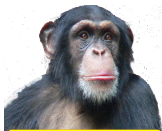
Hoe zo pesten ???