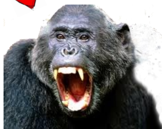
Wie pest hier ???